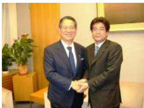
平成19年10月19日 町村官房長官と首相官邸にて