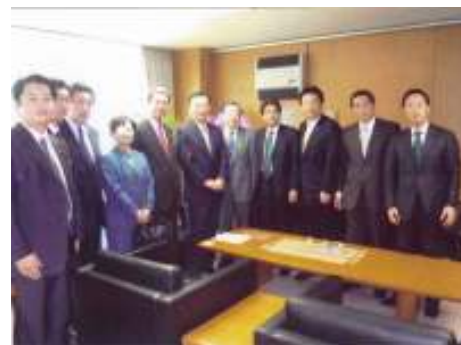
平成19年11月8日 真に必要な公共事業を考える会