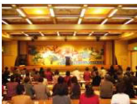
平成19年11月7日 ひまわりの会 移動例会