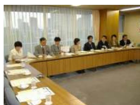
平成19年10月11日 党広報委員会