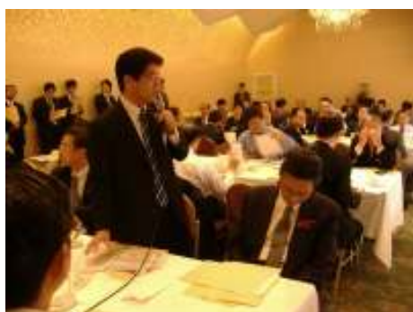
平成19年10月4日 テロ特措法に関する合同部会