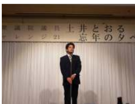
平成19年12月8日 チャレンジ21「忘年のタベ」