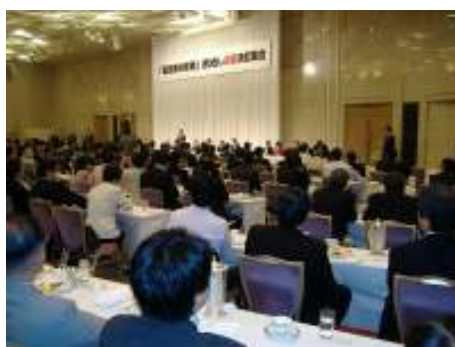
平成19年9月23日 福田康夫先生総決起集会