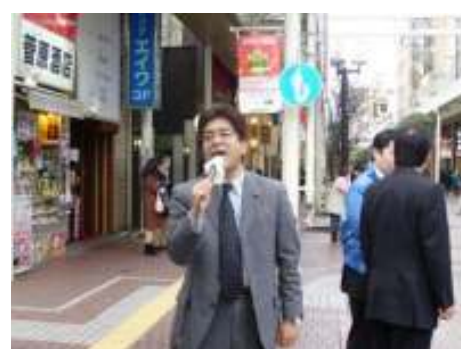
平成19年12月16日 DNA街頭活動